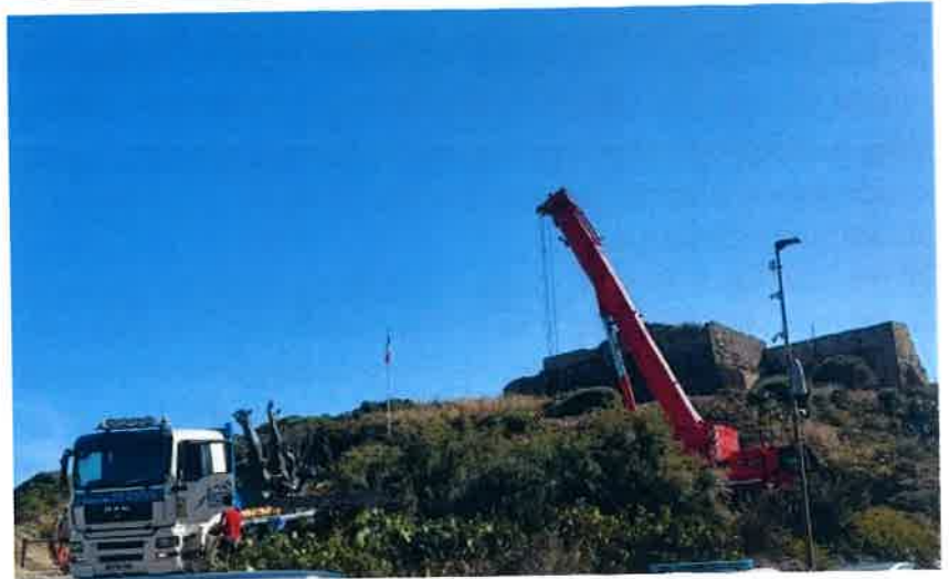
Déploiement de la grue