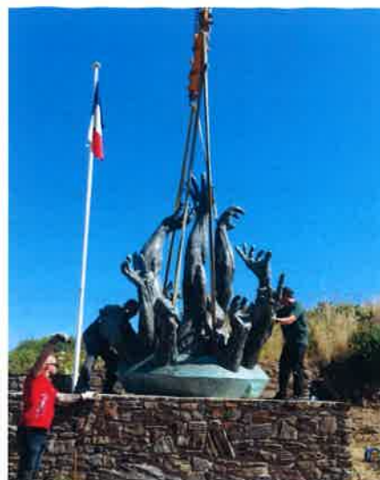
Une tonne et demie de bronze à placer au millimètre