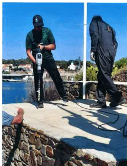
Préparation des scellements