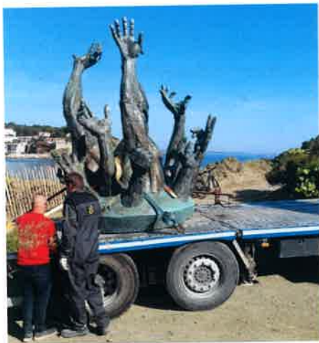
Désarrimage de la structure