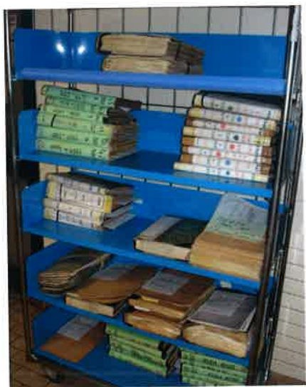
Aperçu d'une semaine de travail au CAPM de Pau

Nous en avons extrait 1700 cas susceptibles d'être des disparus et nous avons ensuite vérifié, un par un, ces différents cas, notamment auprès du Centre des Archives du Personnel Militaire (CAPM) de Pau où sont conservés la majorité des dossiers individuels de presque tous les militaires français.