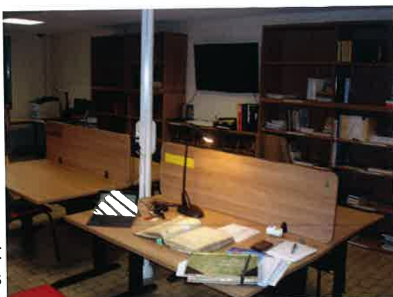
La salle de travail au CAPM à Pau

Ces vérifications nous ont permis d'éliminer tous les cas qui ne relevaient pas de la disparition, telle que nous en avons préalablement défini les caractéristiques.