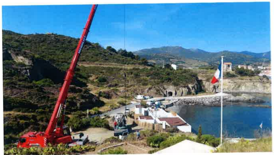
Début du transfert