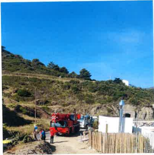
Arrivée du convoi sur le site