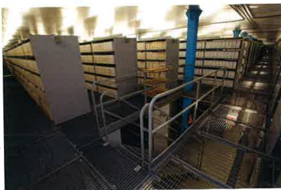
Au SHD, les rayonnages se comptent en kilomètres linéaires

Cette définition étant posée, nous avons alors cherché à dresser la liste nominative des militaires français portés disparus. Ce fut une longue enquête à travers les archives de la guerre d'Algérie, réparties aux quatre coins de la France dans divers organismes militaires ou civils. Des centaines d'heures passées à compulser des milliers de pages poussiéreuses... extraites de rayonnages dont les responsables firent souvent preuve d'une grande disponibilité pour guider SOLDIS dans ses recherches.