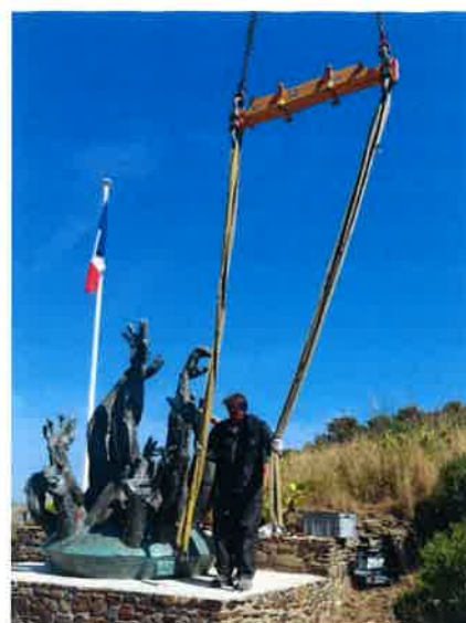
retrait des sangles